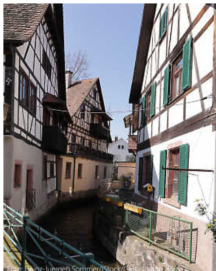
Fachwerkidyll am Ufer der Rench. In Oberkirch ist Heimatgefühl quasi vorprogrammiert.

Und dazwischen? Hier haben die Veranstalter gemeinsam mit einer Vielzahl von lokalen Akteuren, von Winzergenossenschaft bis zum Sportverein, dafür gesorgt, dass kein Wunsch offenbleibt. Von der Weinwanderung bis zur Vogelexkursion: Hier kann man Heimat das gesamte Jahr über erleben, entdecken und genießen. (jr)